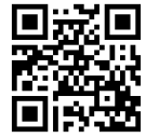
イベント申し込み

イベント開始3時間前に気象警報が出ている場合、イベントが中止となります。詳しくはHPをご覧ください。